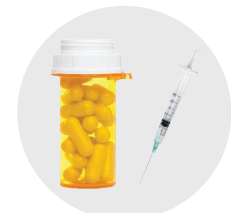
Medicamentos, jeringas, objetos punzantes