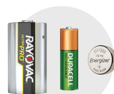
Pilas recargables y para uso en el hogar

Muchos artículos habituales para uso en el hogar pueden contener productos químicos peligrosos o tóxicos. Está prohibido desechar estos artículos en la basura y en el desagüe.