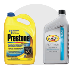
Baterías, aceites, líquidos y filtros para automóviles